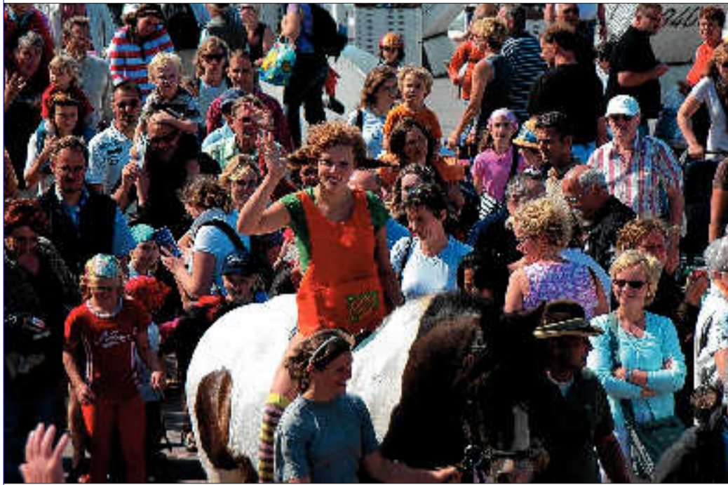
Fast wie ein Triumphzug war Pippis Ritt durch die Fußgängerzone bis zur Musikmuschel.